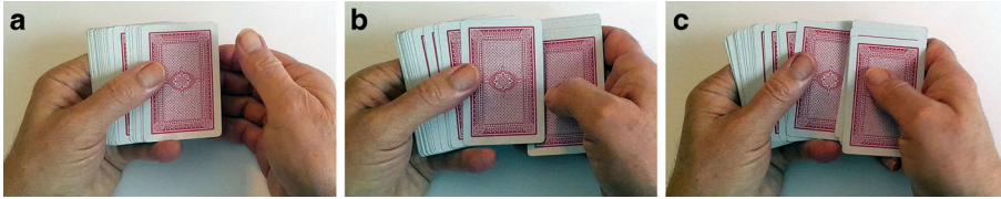
Abb. 2 a Bild 4, b Bild 5, c Bild 6

Man könnte auch noch auf das falsche Abheben hinweisen: Ein zufällig aussehendes Verfahren, bei dem der Stapel in der ursprünglichen Reihenfolge bleibt. Einzelheiten findet man im Internet.